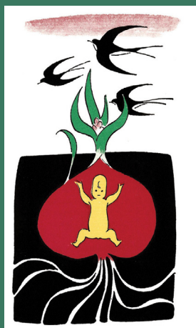
Jeg tror, der ligger et barn dybt inde i alle levende ting, der gror, et barn, der er som en fuglevinge, en lille gud, der er evigt stor.

Halfdans uforlignelige digteråre brugte han også flittigt i sit sociale engagement, eller når han kommenterede tidens store spørgsmål. - På sporet af Halfdan starter ved barndomshjemmet og slutter i Arbejdermuseets smukke nyrestaurerede gård, som giver den helt rette stemning af Halfdan-tidens København.