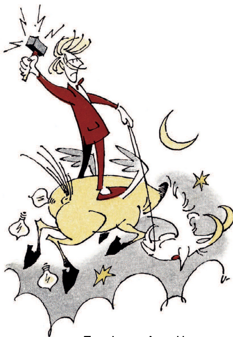
Tegninger: Arne Ungermann

Jeg skriver sjove digte. Jeg skriver osse triste. De første læser andre folk. Selv læser jeg de sidste.